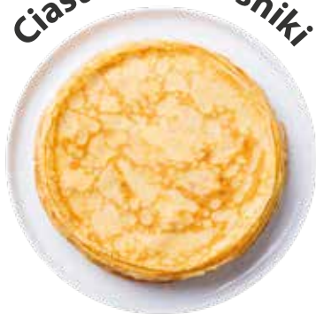
Ciasto na naleśniki